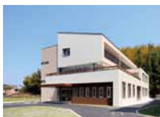
バリアフリー(有)の輝デイサービスセンター (介護予防特化型)