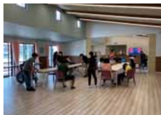
ふれんど・すくえあ活動室の様子