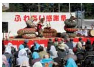
高齢者、障がい者、児童が一体となった法人一番の大イベントです。