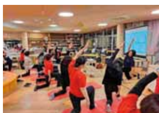
職員研修(腰痛予防)