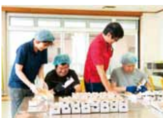
利用者様と職員が声掛け合いながら作業をしている様子です。

若草会は、創立50周年を迎え、創生の里、太平の里、ふく福、宗方こども園、宗方東こども園、府内保育園、しらかば保育園を運営する法人です。地域の方々のお役に立てるようこれからも質の高いサービスを提供させていただきます。