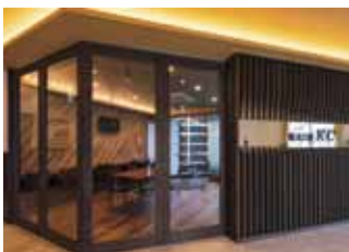
本社カフェスペース

大分市賀来にて、前身のNPO法人時代を含め約20年、障害をもつ方への福祉事業を行っています。