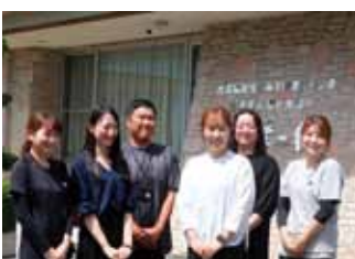
みずほハートリンク (心をつなぐ仲間たち)

「一人ひとりの尊厳を守り、『共育・共生』の地域づくりに貢献する」を経営理念として掲げ、高齢者や障がい児・者などの介護や支援を通して、お客様のウェルビーイングを高め、自分らしく生きることを目指しています。また、パートナーの自己実現も大切に、働きやすい職場づくりを目指している法人です。