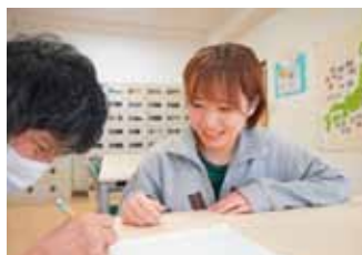
利用児者とのかかわり