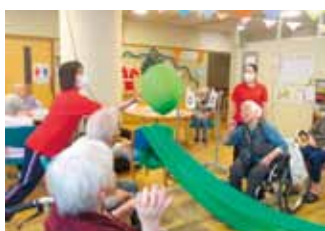
風船バレー大会(アイリスおおいた)