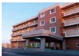
ケアプレイス オリーブ