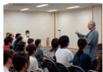
職員んのスキルアップの為の研修を定期的開催しています。