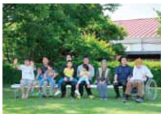
法人理念「共歩・共笑・共育」

0歳～高齢者、障がい者や地域の生活困窮者を対象とした事業を経営している地域密着型の社会福祉法人。入社時の配属先と入社後の異動先を希望でき、OJTやOFF-JTを通じたキャリアアップが図れます。特にSDS(自己啓発支援)では、職員の資格取得を全力支援しています。