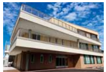
「八風園」が40年ぶりにリニューアル♪