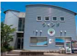
法人を代表する障がい福祉サービス事業所「ウインド」♪

1981年(国際障害者年)より知的障がい者福祉に携わり法人創立46年目。「八風園」(大分市通所授産施設民間第1号)をはじめ、「八風・be」・「ウインド」(森のクレヨン)・「八風・マーヤの園」を中心に大分市に施設展開。その他福祉事業も多数運営。時代に求められる福祉に先駆的に取り組んでいます。