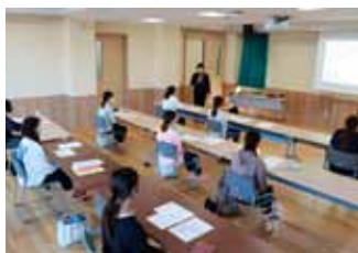
新入職員研修の様子