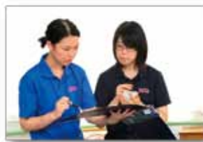
入職後にエルダーがマンツーマンで指導します