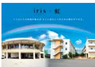
アイリスおおいた・アイリス清心園

さまざまな高齢者福祉事業および障がい事業において、ご入所者・ご利用者の人権・人間性を尊重した施設づくりを基調とし、地域福祉の向上を目指しています。