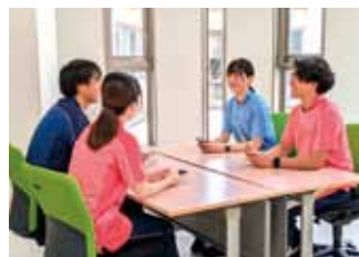
職種間カンファレンス