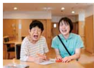
女性が活躍する職場です