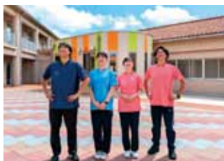
あなたの笑顔がみんなを笑顔にする