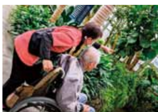
外出行事(アイリス清心園)