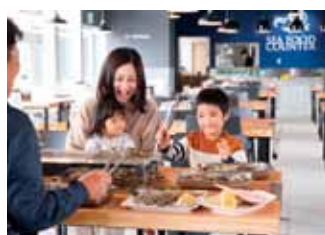
海鮮BBQレストラン「キツキテラス」