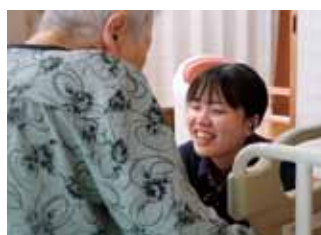
あなたに会えてありがとうございます!