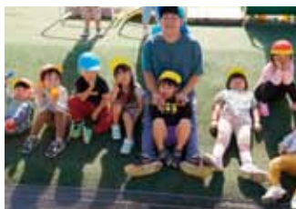
利用児者とのかかわり