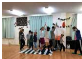
放課後等デイサービス活動の様子