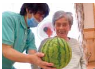
理念に基づいた質の高いサービスを目指しています。