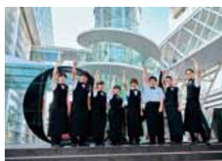
大分県立美術館カフェ・シャリテ