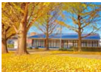
緑豊かな自然に囲まれ、静かで落ち着いた環境にあります