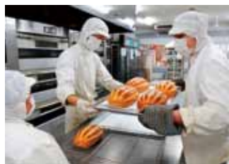
パン作りによる知的に障がいのある方々への就労支援の様子♪