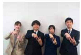
活躍する若手社員

林業 建設業 製造業 ガス業 情報通信業 運輸業 卸・小売業 金融業 不動産・物品賃貸業 専門・技術サービス業 宿泊・飲食業 生活関連サービス・娯楽業 医療・福祉 複合サービス業 その他のサービス業等