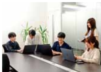
社員の約50%が20代です