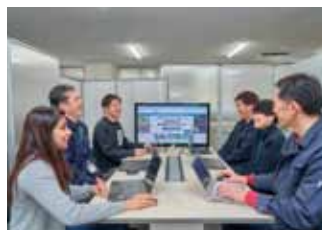
社内ミーティングの様子