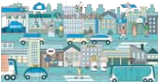
FIGグループの目指す未来像 (Smart Society)

ハードからソフトまで自社で開発する強みを発揮しているモバイルクリエイトでは、部門に関係なくすべての社員がオリジナリティを発揮してチャレンジできる環境があります。開発部門、営業部門、管理部門など、それぞれで個性や可能性を発揮して成長し、当社の未来を担ってください。