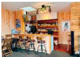
弊社オフィス 休憩スペース