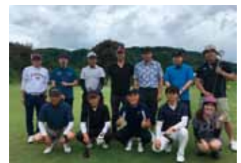
ゴルフコンペの写真 (役員から若手まで)