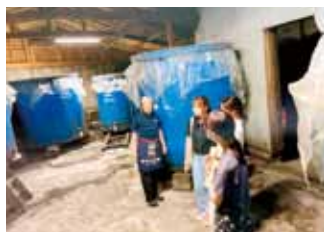
社員旅行 (県内酒蔵見学)