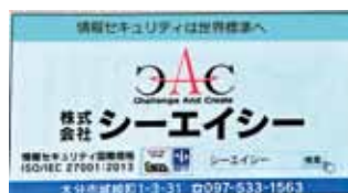
情報セキュリティ