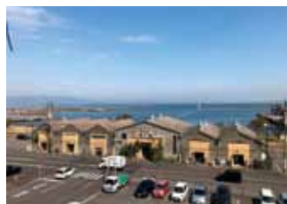
「本社から見える風景」