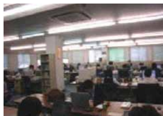
「本社システム部の様子」