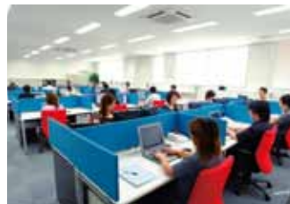
本社執務室の様子

林業 建設業 製造業 ガス業 情報通信業 運輸業 卸・小売業 金融業 不動産・物品賃貸業 専門・技術サービス業 宿泊・飲食業 生活関連サービス業 娯楽業 医療・福祉 複合サービス業 その他のサービス業等