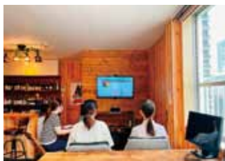
社内勉強会の様子