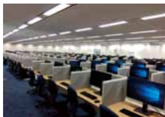
令和7年新設 金池センター データエントリー業務室