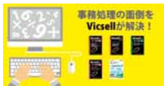
自社パッケージソフト「Vicsellシリーズ」