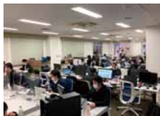
社内開発部屋の様子