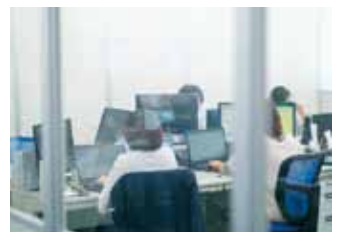
長く働ける職場環境づくりを目指しています