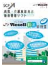
「Vicsell勤怠管理」パンフレット