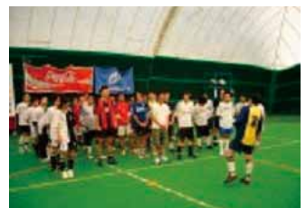
「拠点対抗フットサル大会」